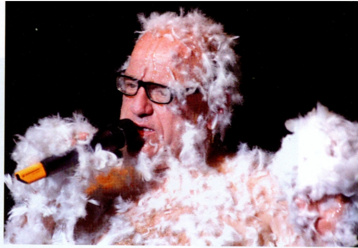
Er übergießt sich mit Honig und lässt sich in einer Turbine federn: Leo Bassi in seiner 11.-September-Show »La Vendetta«

Ich zeige in meiner Show zum Beispiel, dass es vor 17.000 Jahren Höhlenmalereien gab. In Spanien, wo ich lebe, haben wir wunder-