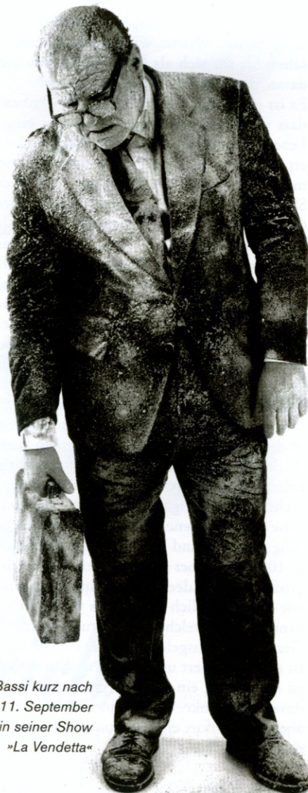
Leo Bassi kurz nach dem 11. September 2001 in seiner Show »La Vendetta«

1789 ist natürlich ein sehr bestimmendes Datum. Denn es war der Augenblick, als die Ideale der Aufklärung auf das reale Leben und die Politik Einfluss nahmen. Diese Ideale, die sozialistische Ideale waren und die die großen Momente der europäischen Philosophie widerspiegeln, sollten wir zurückgewinnen. Sie verkörpern die wahren Werte. Wir haben soeben erlebt, dass das ganze Bankensystem auf billigen Werten basierte. Jetzt müssen wir zu den wahren Werten, zur Kunst, Poesie und Philosophie, zurückkehren. Der Clown steht für Optimismus. Er bringt die Menschen zum Träumen. Und es sind glückliche Träume, die er ihnen beschert. Er hat einen total optimistischen Blick auf die Zukunft. Man kann kein Clown sein, wenn man pessimistisch ist. Der Clown ist optimistisch und altruistisch. Ich habe der Clownkunst mein ganzes Leben gewidmet wie mein Vater und mein Großvater. Ich stamme aus einer Zirkusfamilie, und das alte Geheimnis instinktiver Kraft, das der traditionelle Zirkus dem Publikum vermittelt, übertrage ich in das heutige Leben. Für Clowns gibt es keine Krisen. Clowns haben die enorme Verantwortung, den Glauben an die Zukunft aufrechtzuerhalten. In der Show bin ich anfangs ein Geschäftsmann und am Ende verwandle ich mich in einen Clown.